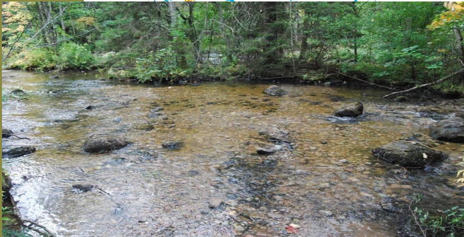
Nyanlagd lekbotten.