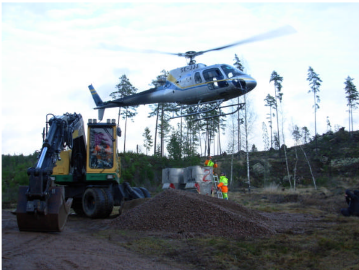
Figur 7. Lekgrusförstärkning till öringen i Silverån, lyfts ut och spreds medhjälp av helikopter.

Emåförbundet administrerar på uppdrag kalkningsverksamheten i Vetlanda och Eksjö kommuner. Länsstyrelsen i Jönköpings län har utvärderat kalkningsverksamheten och följt upp måluppfyllelsen. I stort fungerar kalkningen bra och erforderliga korrigeringar har gjorts i kalkplanerna 2006. En upphandling av kalk genomfördes på våren. Under hösten spreds sedan ca 430 ton kalk i Vetlanda kommun och ca 290 ton inom Eksjö kommun. Kalkspridning sker både med båt och helikopter.