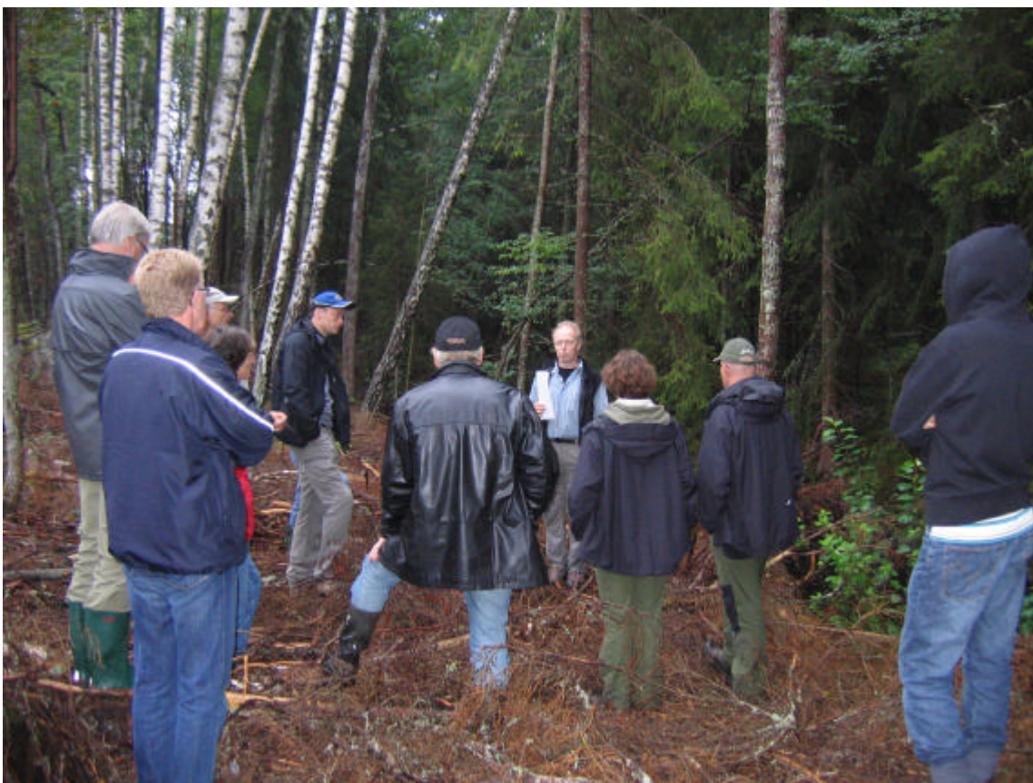
Figur 2 Vattendragsgrupp i Fusån