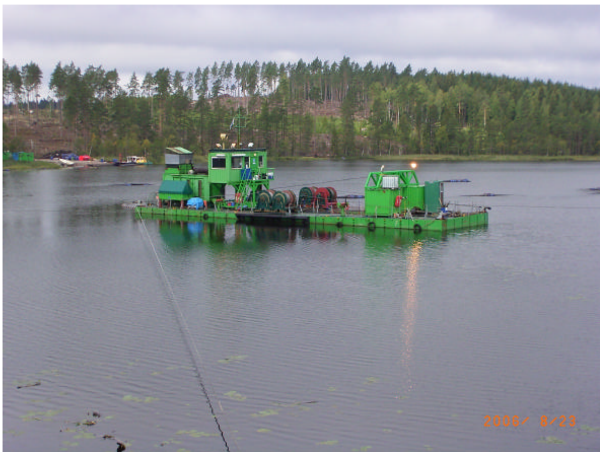
Figur 4. Mudderverket i Övre Svartsjön

Miljökontrollen av vattenkvalitén i Pauliströmsån och Övre och Nedre Svartsjön har fungerat mycket bra. Syrgashalt och turbiditet har mätts kontinuerligt med direktavläsande instrument. Om uppsatta gränsvärden riskerade att överskridas larmades beredskapspersonal. Andra parametrar som till exempel suspenderat material och kvicksilver analyserades och provtogs med automatiska provtagare för samlingsprov. Den elenergi som behövdes alstrades av solpaneler. Muddringsarbetena är avslutade och den mesta av entreprenörens utrustning är nedmonterad och borttransporterad.