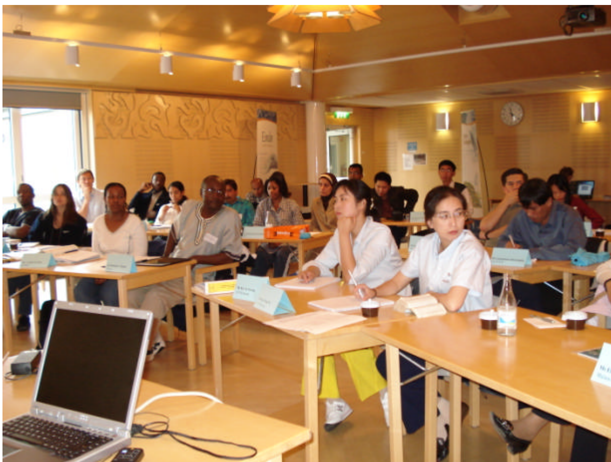
Figur 5. Deltagare från augustiutbildningen

Emåförbundet har tillsammans med Ramboll Natura arrangerat två kursomgångar om vardera fem dagar med inriktning mot avrinningsområdesvis vattenplanering och sakägarmedverkan. 30 personer från 19 olika länder utanför Europa, samt 30 personer från länderna runt Zambezifloden deltog. Kursen hölls i Veland. Under den kursveckan har deltagarna haft växelvis föreläsningar, sakägarseminarier och studiebesök i Emåområdet. Bo Troedsson hade förmånen att delta vid de avslutande fjorton dagarnas utbildning av den ena gruppen i Sydafrika i november. Kursen kommer att genomföras i ytterligare ett antal år. Under 2007 kommer det att genomföras tre utbildningar. En för deltagare från utvecklingsländer i hela världen, en för länderna runt Zambezifloden och en för fransktalande Afrika.