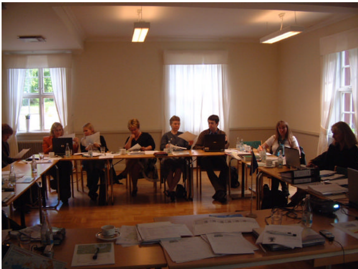
Figur 6. Internationellt ENMaR-workshop om turistfrågor i Trollebo.

Emåförbundet medverkar från och med 2005 i Interreg IIIC-projektet ENMaR (European network for municipalities and rivers) tillsammans med Spanien, England, Tyskland och Lettland. Arbetet bedrivs inom fyra olika komponenter; turism, fysisk planering, vattenservice, jord- och skogsbruk. Syftet med projektet är dels att bilda nätverk mellan länderna och mellan de olika komponenterna och dels att skriva en "guide book" som för 2005 ska beskriva skillnaderna i förutsättningar i de olika länderna. Under 2006 har arbetet med att färdigställa en goda exempelkatalog påbörjats. Internationella möten har hållits i Oldenburg i Tyskland samt för Sveriges och Emåns del på Trollebo skogsvårdsgård i september. Under året har fem regionala möten genomförts. För fysisk planering och vattenservice i juni och för turism och jord- och skog i november och december. För fiskets del har vi valt att fokusera på fisketurismen eftersom vi upplever att Emån har en stor utvecklingspotential och är ett område där Emåförbundet kan hjälpa till. Vi hoppas på så sätt kunna dra fördelar av ENMaR projektet och styra arbetet till sådant vi har nytta av inom Emån.