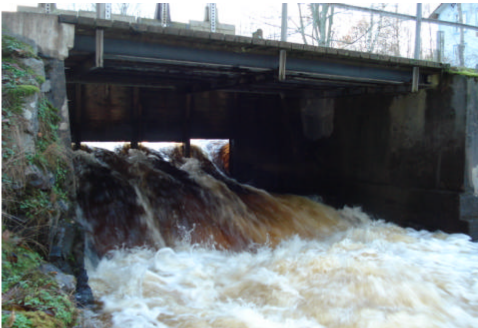
Figur 1. Hjortesjön 2006-11-09.

Under året har Emåförbundet fortsatt arbetet med flödes- och nivåmätning i Emåns avrinningsområde med 11 flödesmätnings- och 7 nivåmätningstationer. Det finns ytterligare stationer etablerade som ännu inte är i drift på grund av att tillförlitliga avbördningskurvor ej kunnat göras.