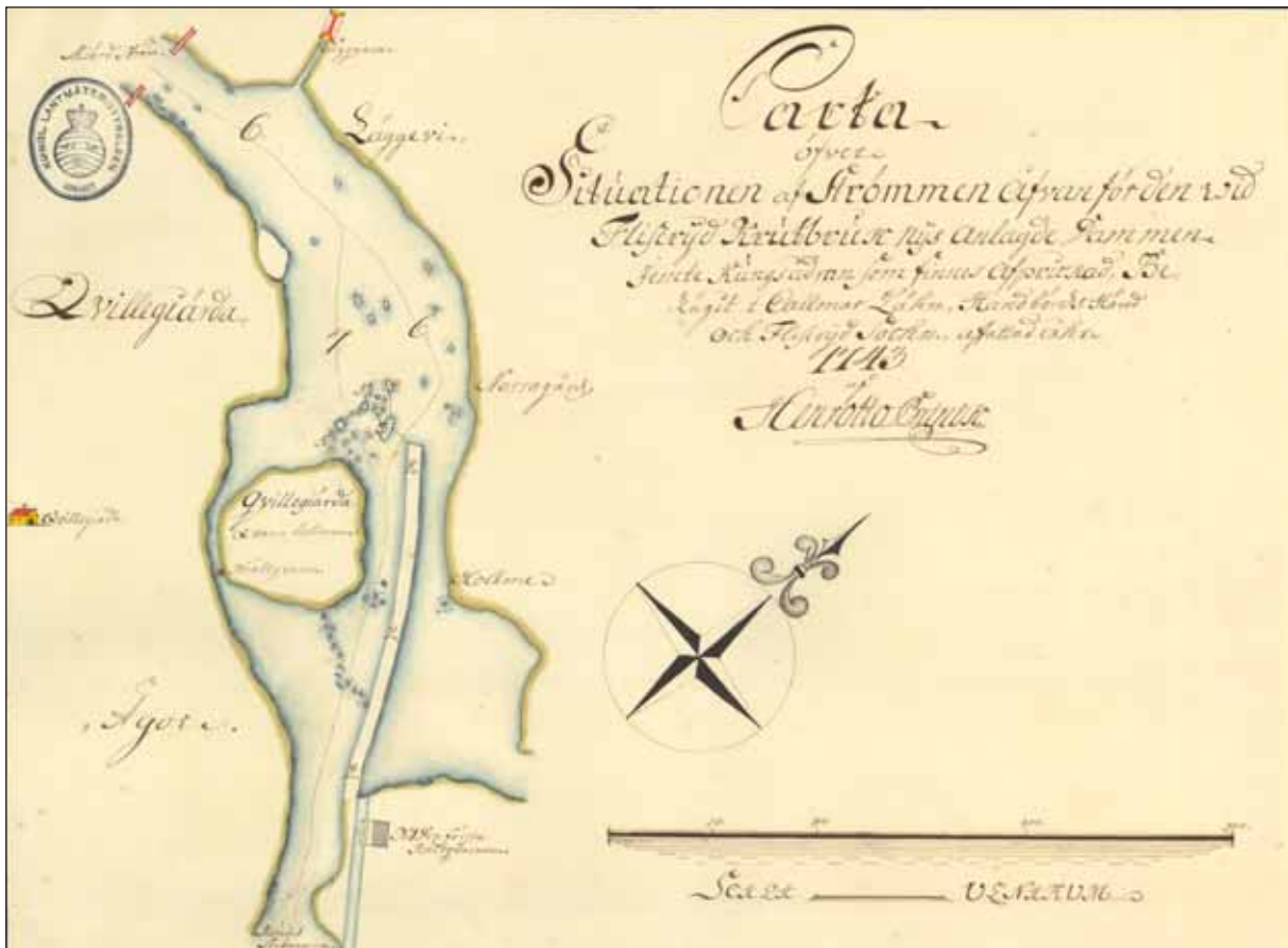
Fig 7. Avmätningsskarta 1743, åtgärdsområde Jungnerholmarna, Emån, lokal 3C-E.