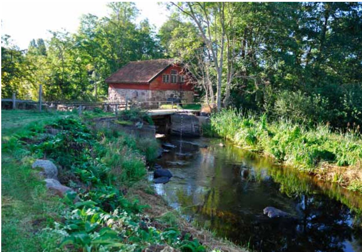
Fig 2. Syrgasfabriken i Virbo, åtgärdsområde 1 i Virån.