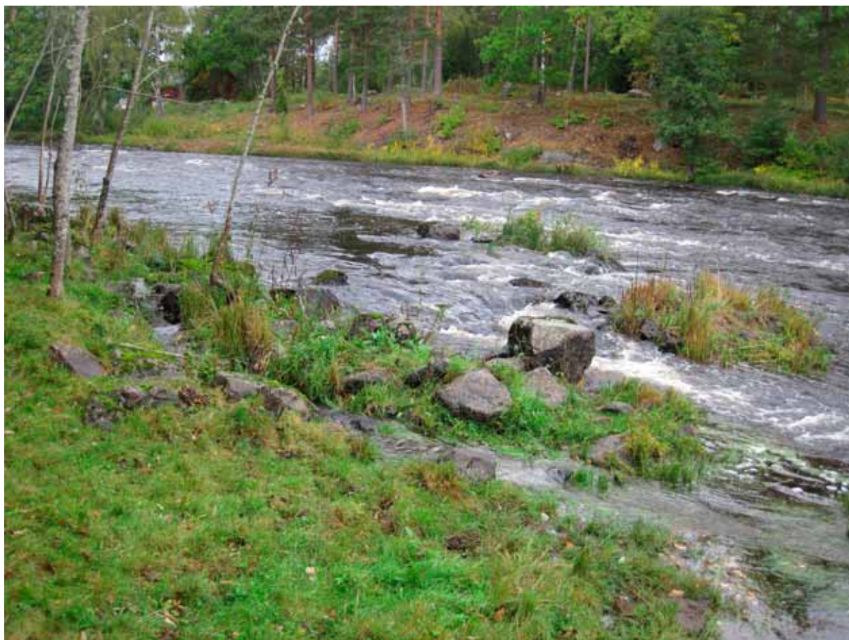
Fig 5. Kvarneströmmen, lokal 8A, åtgärdsområde Grönskog - Jugnerholmarna.