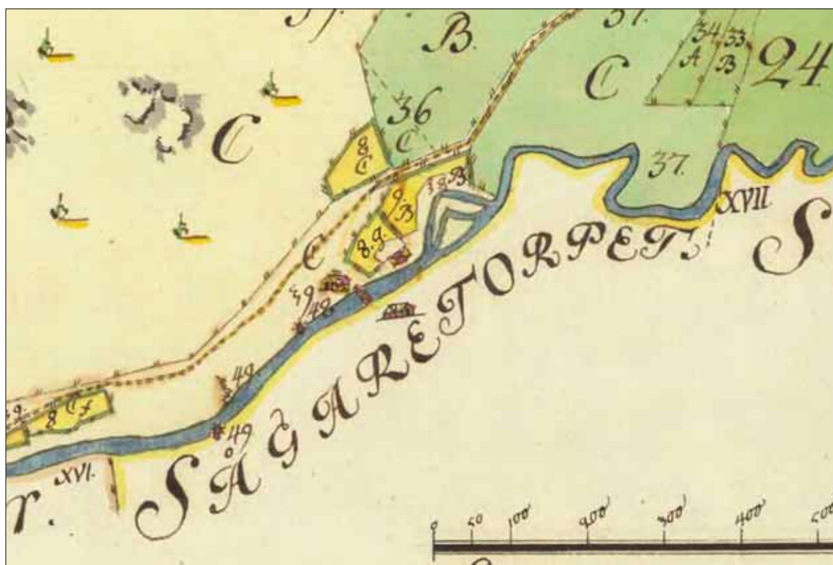
Fig 1. Utsnitt ur storskifteskarta från 1770, Sägaretorpet, Åtgärdsområde 4, Loftaån Skalan visar Svenska Alnar.