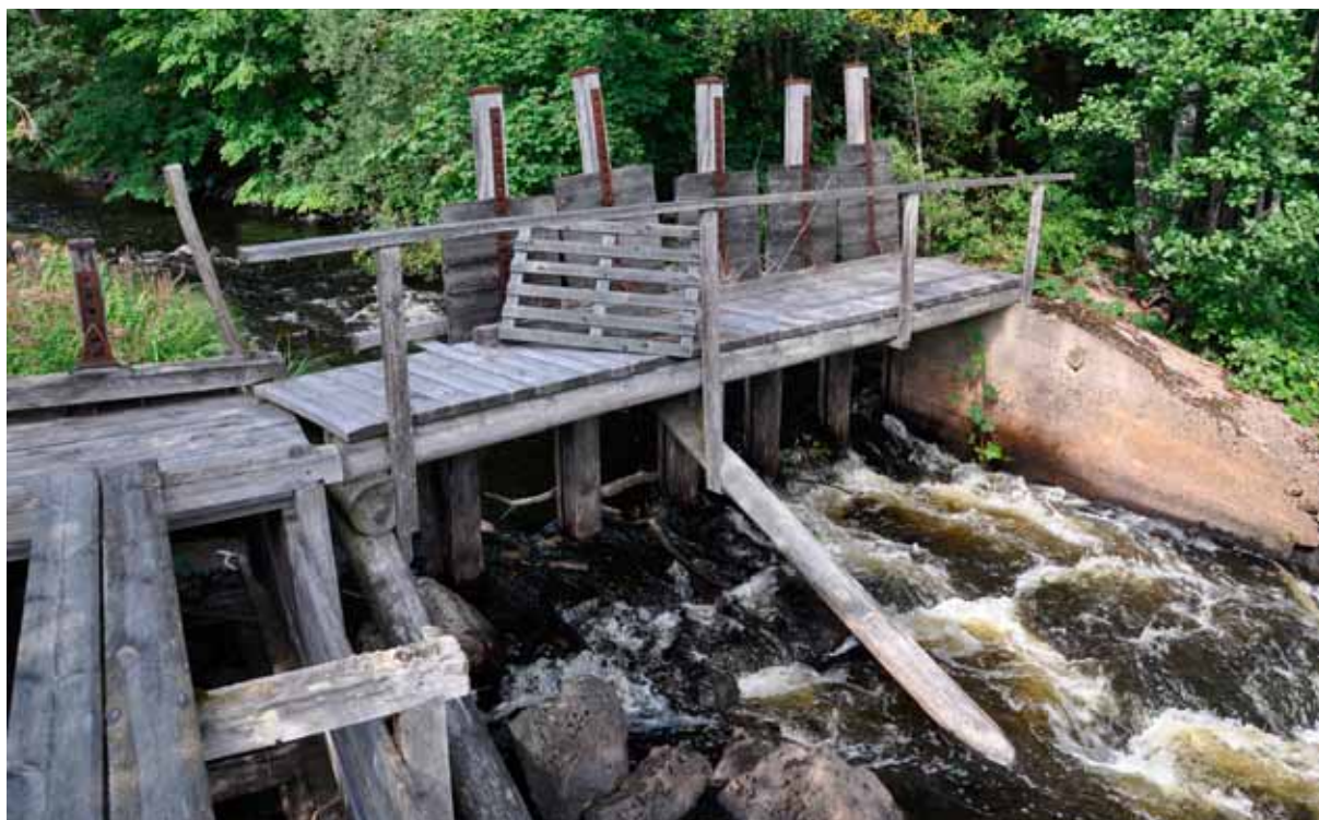
Fig 4. Stensjösåg, åtgärdsområde 4 i Virån.