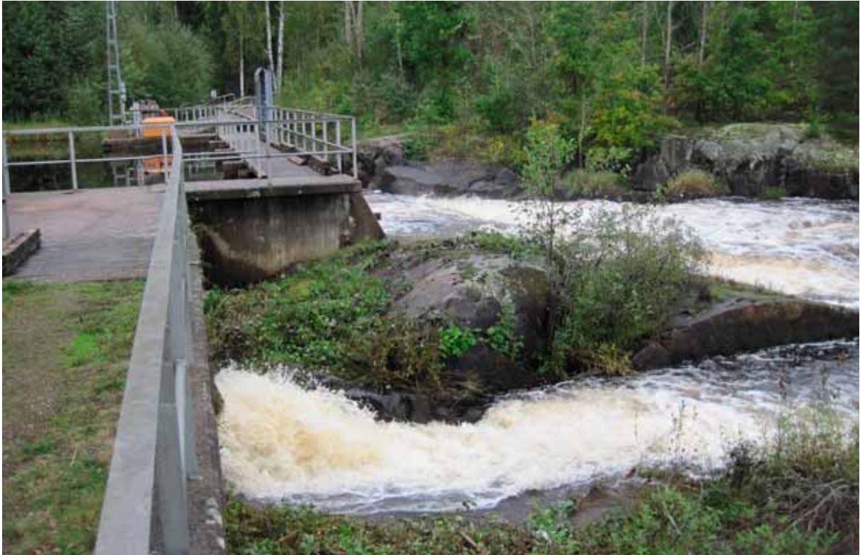
Fig 8. Modern damm i Finsjö, åtgärdsområde Finsjön övre och nedre i Emån.

läns museum anser att arbete i området bör föregås av en särskild arkeologisk utredning som ligger till grund för eventuella ingrepp i området