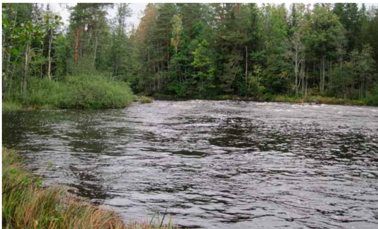
Fig 6. Gäsölehagen, åtgärdsområde Grönskog – Jugnerholmarna, Emån i Fliseryd.