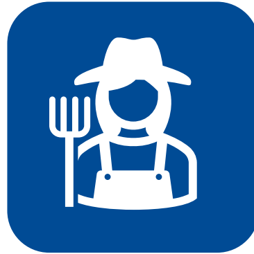
Stöden via Jordbruksverket