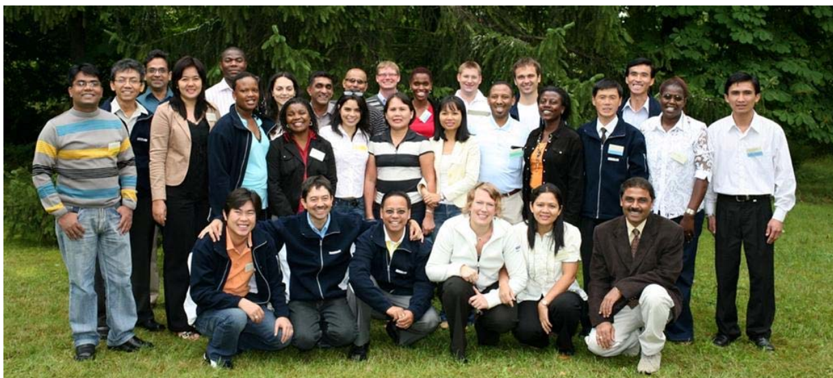
Figur 5. Deltagare från augustiutbildningen

Emåförbundet har tillsammans med Ramboll Natura arrangerat tre kursomgångar om vardera fem dagar med inriktning mot avrinningsområdesvis vattenplanering och sakägarmedverkan. I den globala gruppen deltog 30 personer från 21 olika länder utanför Europa, i den västafrikanska gruppen 30 personer från 10 olika fransktalande länder samt 30 personer från 8 länder runt Zambezifloden. Den kurserna hölls i Velandå. Under kursveckan i Emåområdet har deltagarna haft växelvis föreläsningar, sakägarseminarier och studiebesök i Emåområdet. Även under 2009 kommer det att genomföras tre utbildningar från samma delar av världen som 2008.