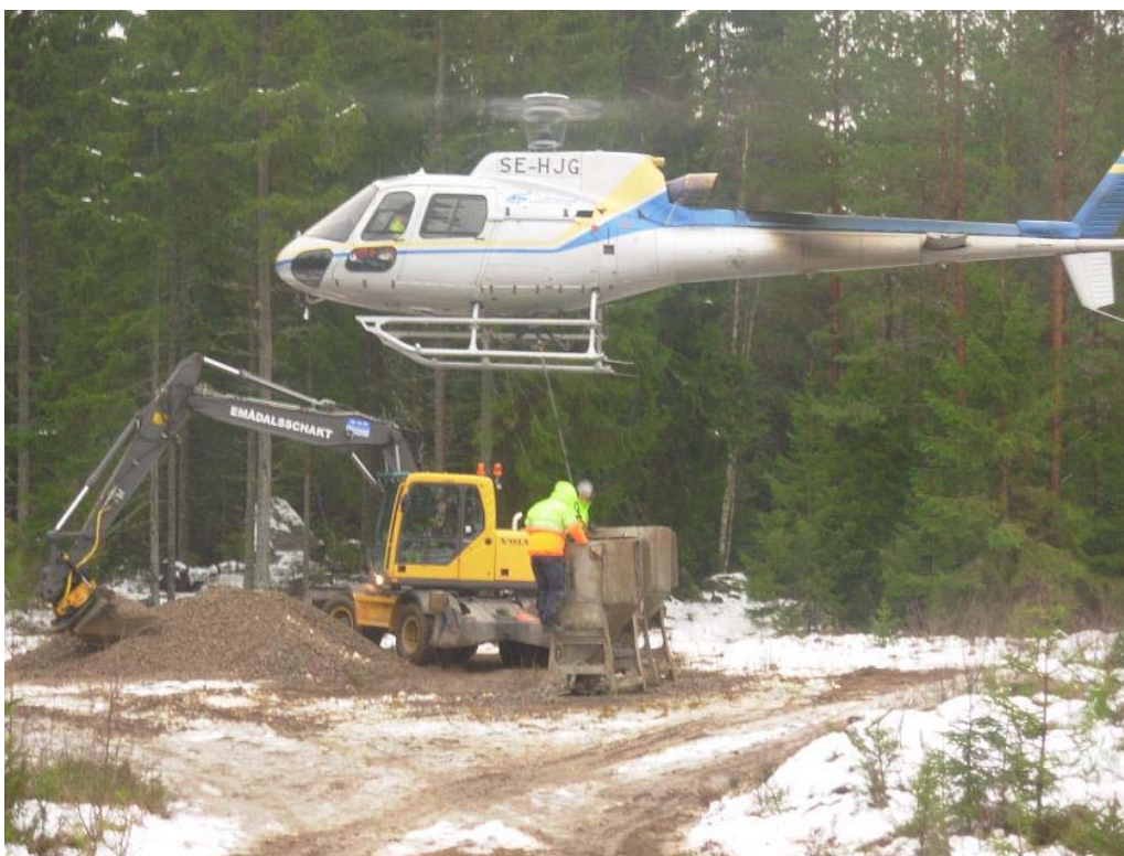
Lekområden för öring skapades i Sällevadsån, Pauliströmsån och Ålhusbäcken. Lekgruset flögs ut med helikopter.

Emåförbundet har även varit delaktiga i återställningsarbeten i Sällevadsån, Pauliströmsån, Lillån och Ålhusbäcken på uppdrag av Hultsfreds kommun.