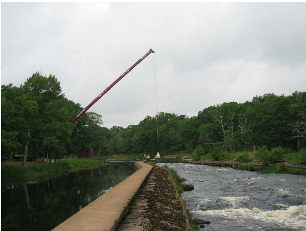
Figur 3. Upptagning av sandsäckar vid utloppet av Emån 08-07-11.

På grund av lite nederbörd under våren sjönk flödet kontinuerligt vilket gjorde att SCMS var den 11 juli tvungna att lägga ut sandsäckar i anslutning till vattenintaget till bruket för att säkerställa vattentillförseln för processen, se figur 3. Säckarna var på plats i en dryg vecka. Därefter ökade flödet återigen. Under november och december var flödena mycket höga för årstiden på grund av mycket nederbörd och fulla grundvattenmagasin.