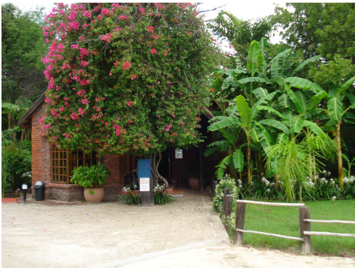
Figur 7, Kaisosi River Lodge

Inledande diskussioner har hållits för att samarbete mellan Maun i Botswana och Hultsfreds Kommun.