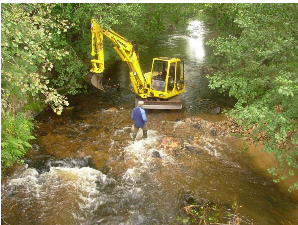
Ett rensad och sänkt parti av Fuseån restaureras av Emåförbundet hösten 2008.

Emåförbundet har även varit delaktiga i återställningsarbeten i Sällevadsån, Pauliströmsån, Lillån och Ålhusbäcken på uppdrag av Hultsfreds kommun.